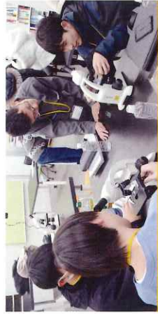
宿泊型スクーリング

各キャンパスでは、美術館やスポーツ施設などへの校外学習も積極的に行っています。普段の授業では得られない学びを、実際の体験を通じて深めます。