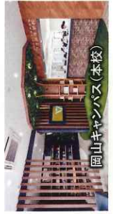
岡山キャンパス(本校)