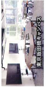
東京飯田橋キャンパス

ワオ高校が東京飯田橋キャンパス、大阪梅田キャンパス、岡山キャンパスで開講している「通学コース」では、専属コーチが生徒の学習管理を行い、自学自習を丁寧に支援しているので、別途サポート校に通わずともきちんと単位修得することができます。英会話やプログラミングなど充実したプログラムに加え、定期的に美術館やスポーツ施設での校外学習も実施しています。