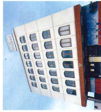
岡山キャンパス(本校)