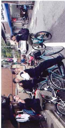
国内スタディツアー

日本各地を訪れ、地域課題を地元の方々と一緒に探究します。単なる旅行ではなく、地域との交流や課題解決型の学びを大切にしたい体験型プログラムです。