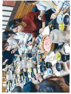
夕食はみんな楽しんで