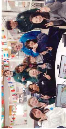
海外スタディツアー

日本各地を訪れ、地域課題を地元の方々と一緒に探究します。単なる旅行ではなく、地域との交流や課題解決型の学びを大切にしたい体験型プログラムです。