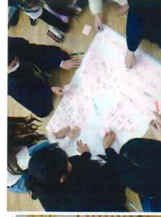
教養探究でグループワーク