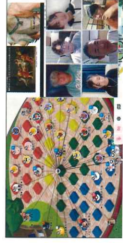
いつでもつながれる「バーチャルキャンパス」

ワオ高校の必修授業である教養探究では、数週間に一度、オンライン上に集い対話型の授業を行います。物事の本質や意義を見きわめ、「答えが一つに絞れない」問題を考え抜く姿勢を養います。哲学・科学・経済というテーマを通して社会の問題に向き合い、学ぶことの楽しさを味わいます。