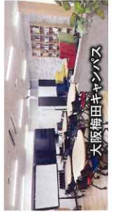
大阪梅田キャンパス